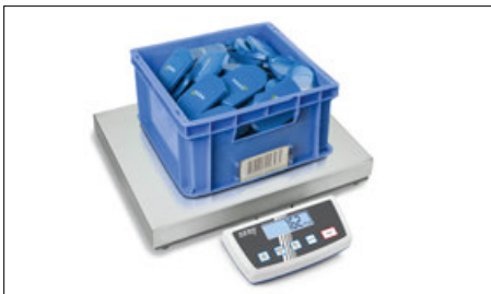
Comptage de pièces

Modèle au succès jamais démenti avec afficheur étanche à l'eau et à la poussière