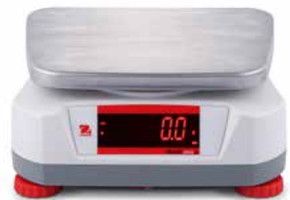
Display an der Rückseite