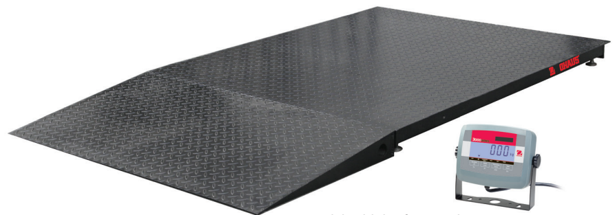
Edelstahlplattform und Rampe mit T31P Anzeigegerät abgebildet