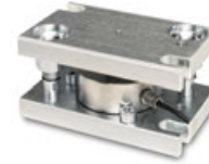
Abb. zeigt Zubehör Lastecke 1 SAUTER CE Q42901, weiteres Zubehör im Webshop