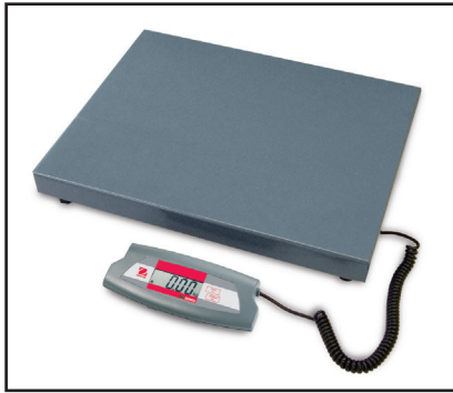
Modelle mit 75 kg und 200 kg sind wahlweise mit großer Plattform verfügbar