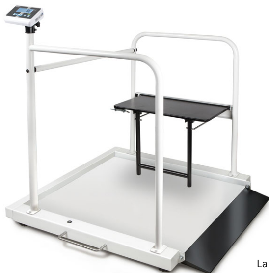
La figure montre MWA 300K-1M + MWA-A04

Plateforme de pesée pour chaise roulante avec rampe d'accès intégrée et set barre de retenue avec strapontin – avec approbation d'homologation et médicale pour une utilisation professionnelle stationnaire dans le diagnostic médical