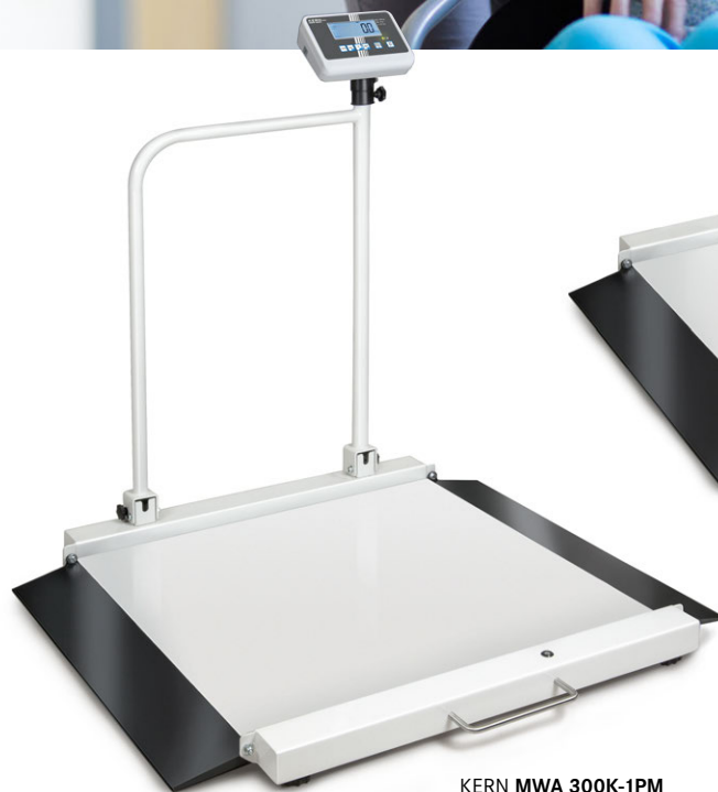
KERN MWA 300K-1PM